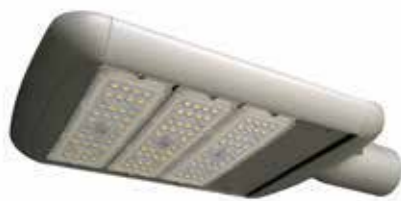
90W - 120W